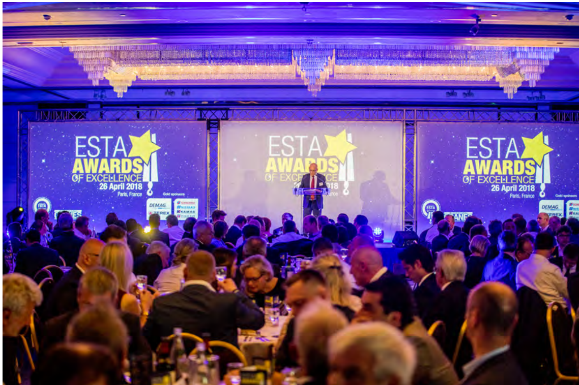
'COMO ESTÁBAMOS, Y ESPERAMOS ESTAR EL AÑO QUE VIENE'