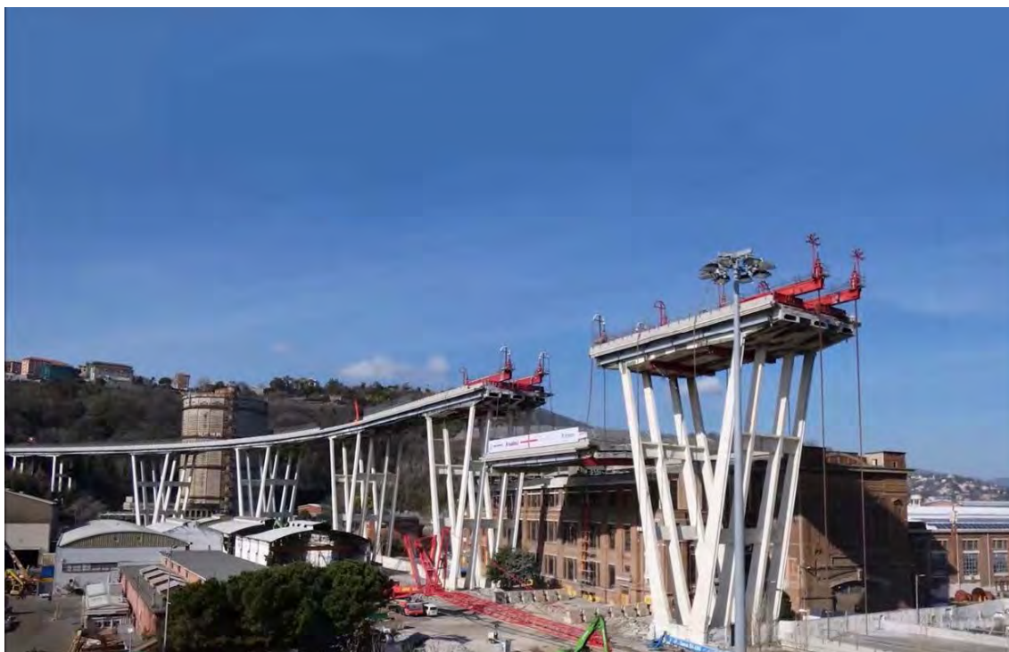
GANADOR DEL PREMIO 2020 TÉCNICAS COMBINADAS Y SPMT- FAGIOLI