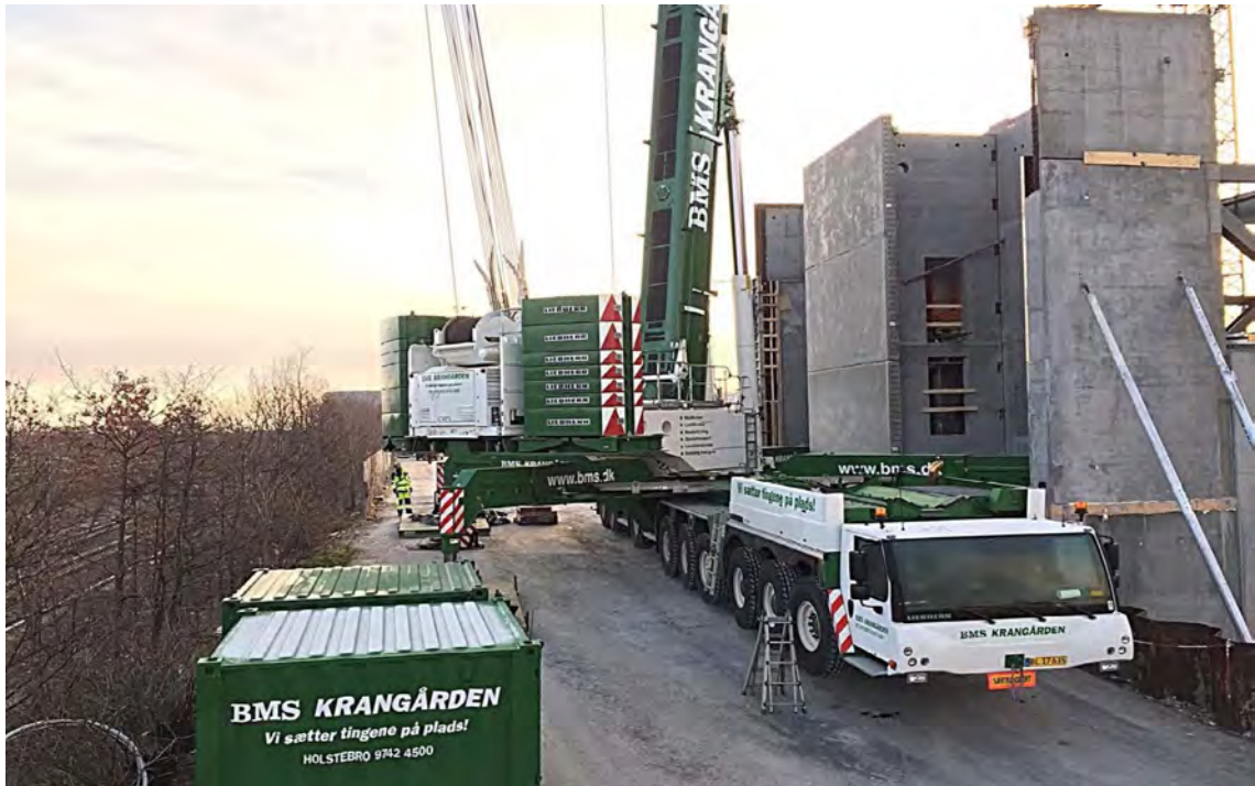
GANADOR DEL PREMIO 2020 GRÚAS TELESCÓPICAS, CAPACIDAD DE IZADO SUPERIOR A 120 TONELADAS - BMS